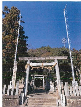
東3パブリックスペース