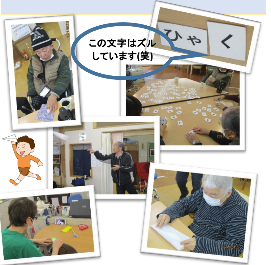
この文字はズルしています(笑)

今月は【ことば探し】や子どもの頃に一度は作ったことがある【紙飛行機】をおこないました。何十年も昔の記憶を呼び起こし、皆さん懸命に紙飛行機を折って見えましたよ！ことば探しは、机に並べられた50音からことばを探し出すゲーム。文字数が増えるたびに難易度が上がり、頭をフル回転させて見えました！