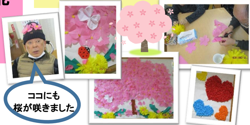
ココにも桜が咲きました

2月はバレンタイン♡ 花紙を丸めたり切ったりして大きなハートを作りました。愛情たっぷりの壁画が出来上がりました！そして、もうすぐ春ということで、一足先にデイルーム前には桜が満開になりました。チョウチョやテントウムシもやってきましたよ！