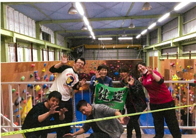
ボルダリングとスタックライン体験(2/27)

スタッフ同士のちょっとした気持ちのズレで離職に繋がらないように、スタッフが主体的にクラブ活動をしています。交流を通して、お互いのことを知り、信頼・支え合える安心な職場を目指しています♪ お知り合いをぜひご紹介ください♪