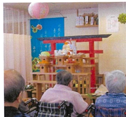
新年の寿ぎ(今年は1/10予定)