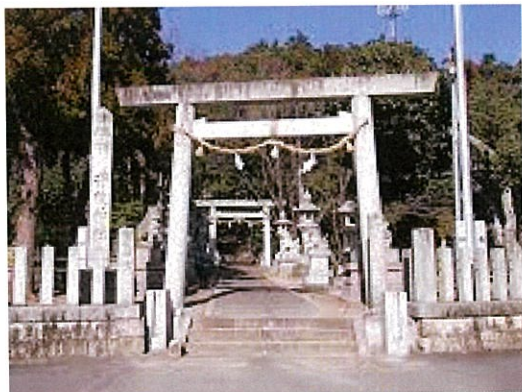
朝日町の井後(いじり)神社

「往還神社」は平成20年職員手造りによるものです。伊勢神宮、井後神社だけでなく高千穂神宮、宇佐八幡、椿大社、大神神社、熊野大社などのお札が入っています。今年一年、ありふれた日常の無事をお願いしたいものです。