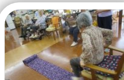
ペットボトル引き寄せ