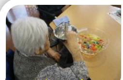
スーパーボールすくい