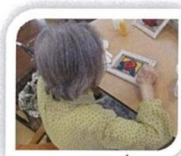
つまようじて 絵具をのぼす

6月は夏におけて涼しげなステンドグラス 風壁掛けorスタンドを作りました。今は1 00均で何でも売っている時代。ガラス絵 具なるものを発見し、「これはいける」 と、さっそく作ってみました。