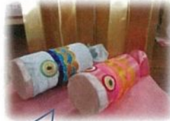
スタッフの飾りつけ