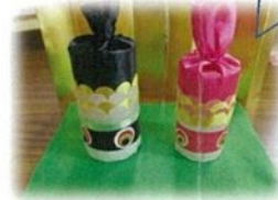
利用者様の飾りつけ しゃちほこ!?