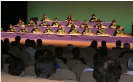
11月3日 川越ふれあい祭りに行ってきました(参加21名)。色々な出し物を観ました。