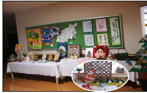
11月16日～ 秋の文化祭作品コンクールをしました。利用者の方や職員が頑張った傑作が揃いました。