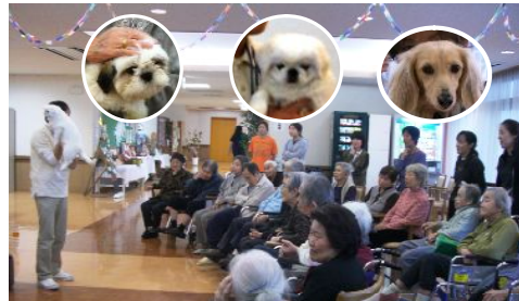
11月14日 アニマルセラピーがありました。3匹のわんちゃんが遊びに来てくれました。